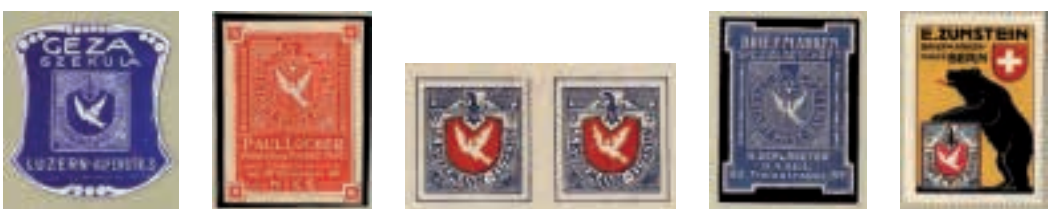
Werbevignetten von Mitgliedern

Die Mitglieder des Verbandes hatten zu Beginn schwierige Zeiten zu überstehen, angefangen mit dem Ersten Weltkrieg bis zur Weltwirtschaftskrise, die weit in die 30er-Jahre hinein reichte.