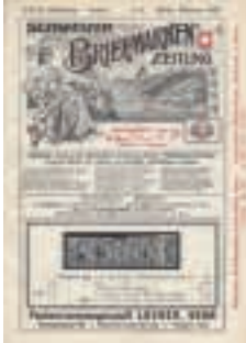
Titelseite der Schweizerischen Briefmarkenzeitung von 1914